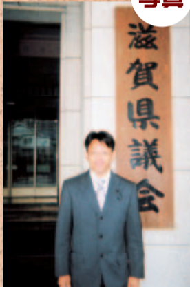
●4/30(月・祝) 任期初日 緊張と責任の大きさに身が引き締まる