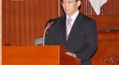
●6/13(水) 県議会一般質問で初登壇