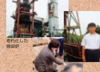
●8/4(土) RD最終処分場県現地説明会 嘉田知事に現場状況の説明をする