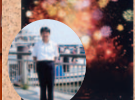
●8/1(水) びわこまつり2007出港式