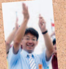
●7/21(土)(光景戦) 母校栗東高校野球部県大会応援