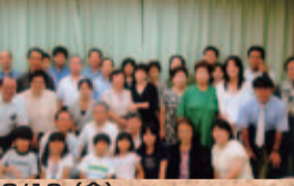
●8/10(金) 県政報告会で地域振興策について語る