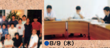
●8/9(木) RDの今後の対策について議員仲間と県幹部の説明をうける