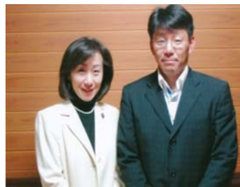
同世代・林久美子参議院議員と共に「国・県の子育て施策」策定にむけ栗東市内で協議(滋賀県の子育て環境の充実へ共に頑張ります)