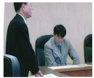
栗東市政が市民に対して『住民本位・情報公開・説明責任』をしっかりとできているのか栗東市長の姿勢を県議会から厳しくチェックする