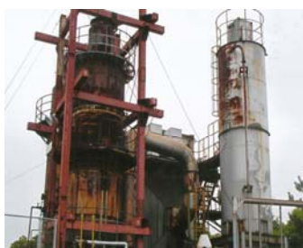
10年来の願い。いよいよ6月末迄にRD焼却炉2基ついに撤去へ(30日住民との協議予定！)