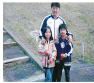
年数回の休日。我が子とグラウンドゴルフを楽しみ、この子達の未来が明るく元気な社会となることを願う！！(栗東野川運動公園にて)