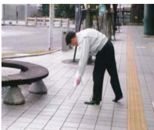
3年間雨の日も雪の日も駅前前で続けてきた早朝の定期的なゴミ拾い「街も心もキレイが基本！」