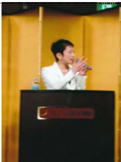
「事業仕分け」の仕組みについて 蓮紡参議院議員の講義に学ぶ