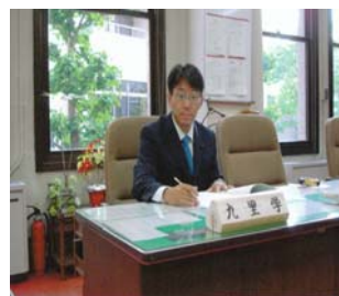
平成22年度県議会活動いよいよスタート(上記委員会所属)県民生活を守るためひたむきに活動