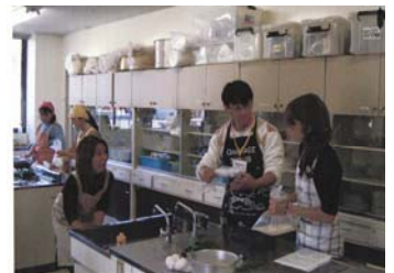
「男女共同参画社会づくり」学校行事に参加「おやつや手づくり地産地消推進の料理教室へ参加しお母さん方の意見をきく