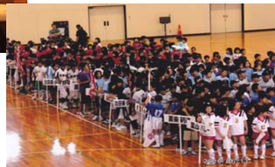
栗東市スポーツ少年団大会開会式に参加。子ども達の未来に向かって希望のいだける県土づくりのためこれからも精進することを誓う。