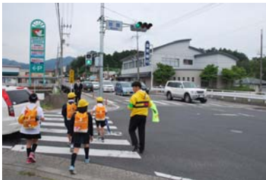
御園交差点・総栗東アルプラ前の交差点立ちを定期的実施。子ども達の「おはようございます」の声が今日も元気の源です。

連日暑い日が続きますが、皆さんお変わりございませんか。首相による消費税増税論議や高齢者医療の新制度導入など、国においては各党で議論が戦われていますが、地方においては日々の生活や労働に苦慮されている方が大半です。机上の空論だけではなく、現場や県民の皆さんのお声に謙虚に耳を傾け、誰もが元気に生活できるヒューマンイズムあふれる政治の構築のためにはまず『議員自らが身を削る』ことが何より大切だと考えます。3年前から進めている滋賀県議会改革のための議員報酬削減や定数削減、さらには費用弁償の見直しなど議会関連予算についても仕分けます。