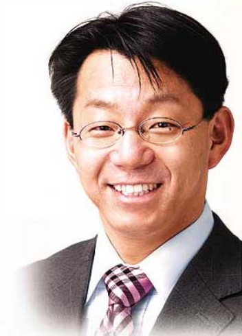
くのり学の活動をホームページで是非ご覧下さい! http://www.9ri.jp

連日暑い日が続きますが、皆さんお変わりございませんか。首相による消費税増税論議や高齢者医療の新制度導入など、国においては各党で議論が戦われていますが、地方においては日々の生活や労働に苦慮されている方が大半です。机上の空論だけではなく、現場や県民の皆さんのお声に謙虚に耳を傾け、誰もが元気に生活できるヒューマンイズムあふれる政治の構築のためにはまず『議員自らが身を削る』ことが何より大切だと考えます。3年前から進めている滋賀県議会改革のための議員報酬削減や定数削減、さらには費用弁償の見直しなど議会関連予算についても仕分けます。