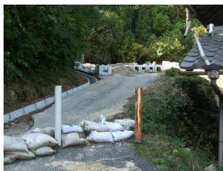
住居間近の治山事業をまず早急に復旧工事を行いました(金勝学区各地)