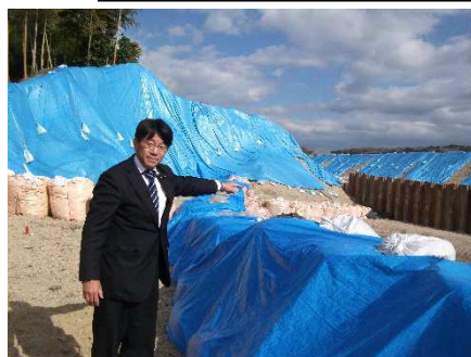
台風18号で甚大な被害を受けた金勝川ルート変更箇所の工事進捗状況調査の為目川の現場と被災宅を伺いました。