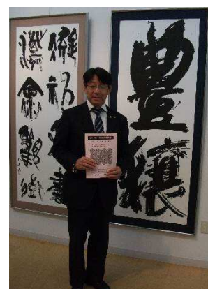
『第37回栗東市美術展』で平面・立体・工芸・書・写真の力作を拝見しました。