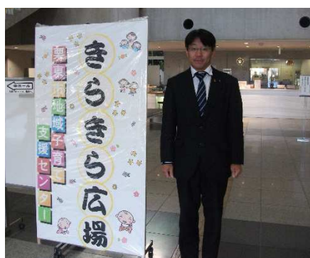
地域子育て支援事業「きらきら広場」に参加し子育て中の市内のお母さんや子ども達と一緒に楽しませていただきました。