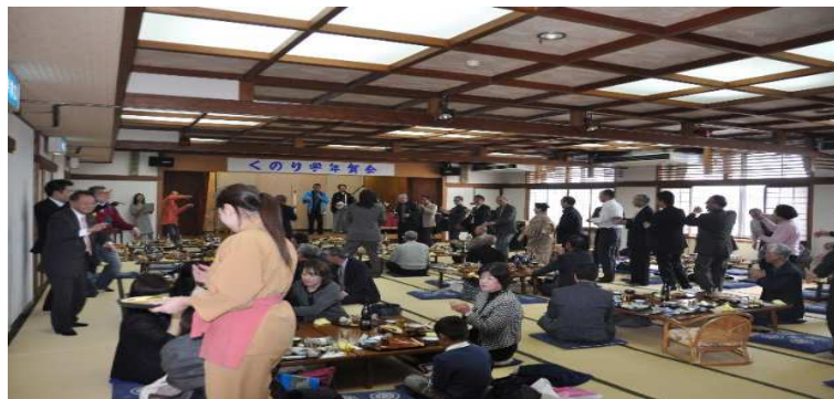
お陰様で今年も90人を超える支援者に囲まれ大盛況!