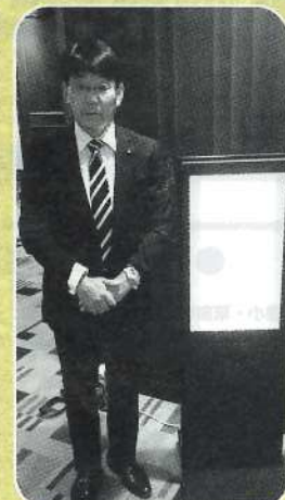
▲「地方議会活性化シンポジウム」に滋賀県を代表して出席 (11月19日・東京シラトン都ホテル)