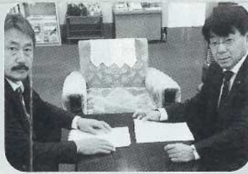
▲県学童連協の役員さんの請願を受け、子育て要望を拜聴する(12月3日・会派室にて)

※職員を1教室あたり2人以上、うち1人は保育士・社会福祉士の有資格者であることが決められたことで専門性が必要と国が決めたが、待機児童問題解消から基準を撤廃し、地方の裁量に今回委ねることにした。