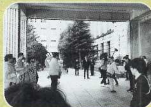
▲子どもの虐待防止に向けてオレンジリボン出発式に参列 (11月・県庁前)