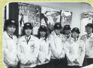
▲全国女性消防団活性化滋賀大会で激励 (11月9日・ウカルちゃんアリーナ)