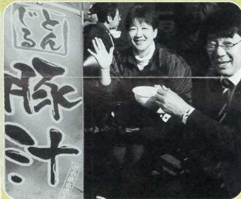
▲晩秋の週末は各学区民フェスタや文化祭・華道展等で地域の皆さんと楽しく談笑する (11月中・市内各地)