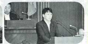
▲県議会で討論する