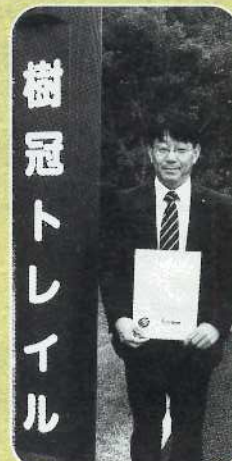
▲琵琶湖博物館リニューアルテープカットに参列。滋賀の観光スポットになる予感 (11月3日・草津烏丸半島)