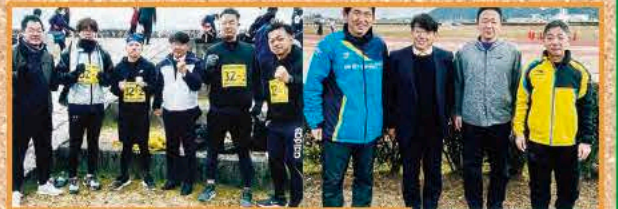
記念の「第50回びわこ栗東駅伝クローン」在野洲川川で選手の方々に激励 (2/11 (日) 栗東市野洲川運動公園)