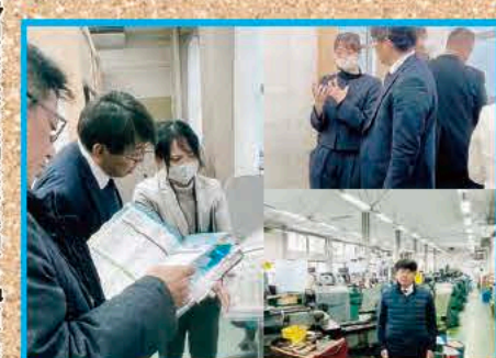
会派県外調査研修 (不登校対策・フリースクール・働き方改革・子育て支援・高等の現状を拝聴) (2/5 (月)~6 (火) 愛知県)