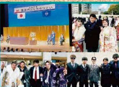
【はたちのつどい】で新成人の若人に激励する (1/7 (日) さくら)