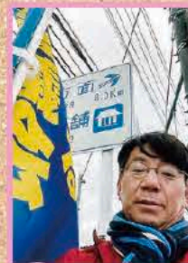
年中の交差点や駅立ちも18年目をむかえる (2/1 (木) 市内各地)