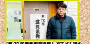
【第70回県教育美術展】で子ども達の秀作に感服 (1/30 (火)~2/4 (日) 県博)