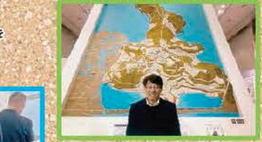
県文化財行政の保存と活用を進める (2/11 (日)~17 (土) 安土・大津・栗東の各施設)