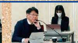
令和6年度県予算部局別審査 (1/9 (火)~1/15 (月) 県庁)