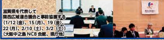
滋賀県を代表して関西広域連合会議と事前協議する (1/12 (金)、15 (月)、19 (金)、22 (月)、2/10 (土)、3/2 (土) 大阪中之島 NCB 会館、県庁他)