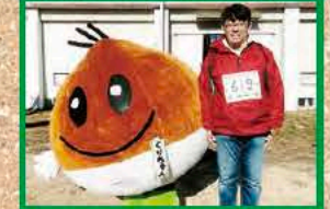
70回開会式ベアリング登山会に参加 (14日・金勝山)